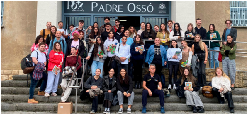
Imagen encuentro con alumnado Educación Social

Asimismo, el 16 de octubre se celebró en los Cines Embajadores de Oviedo el cinefórum “Colombia fue nuestra”, con la proyección del documental “Colombia in my arms” y un coloquio posterior con Javier Orozco, coordinador del Programa Asturiano de Atención a Víctimas de la Violencia en Colombia (PAV-ASTURCOLOMBIA). La actividad buscó generar reflexión en torno al conflicto armado, los retos de la implementación del acuerdo de paz y las perspectivas de la sociedad civil colombiana.