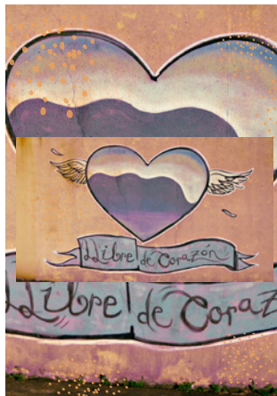
Imagen portadas revista y fanzine del programa "Construimos Juntas"