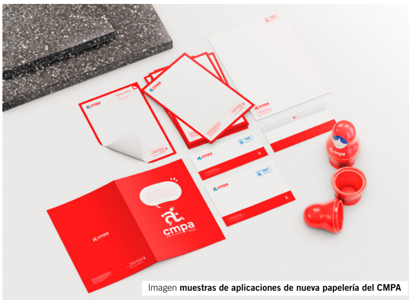
Imagen muestras de aplicaciones de nueva papelería del CMPA