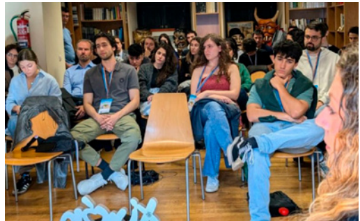
Imágenes Cartel AfroUviéu y participantes Jornada de Emancipación Juvenil “Aquí no hay quien viva”