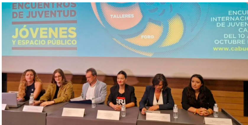
Imagen presentación de los 42º Encuentros Internacionales de Juventud de Cabueñes

El CMPA participó activamente en la definición de contenidos, en la logística de las actividades y en la difusión entre los Consejos Locales de Mecedá. Asimismo, se apoyó la asistencia de ponentes y colectivos juveniles, favoreciendo un espacio de encuentro intergeneracional y plural que permitió compartir experiencias, herramientas y propuestas de transformación social desde la juventud.