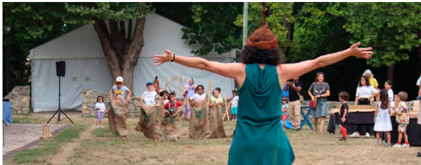
Imagen actividades infantiles en la Folixa pola Paz

Ambas actividades se alinean con los objetivos del CMPA de fomentar la educación para la ciudadanía global entre la juventud asturiana, ampliando las miradas sobre el mundo e impulsando una participación crítica y solidaria.