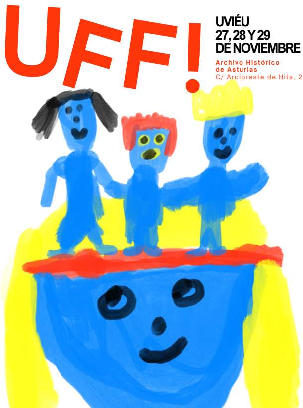
Imagen Jornadas UFF!

Por lo que respecta a las demandas fundamentales podemos hacer dos divisiones. Por una parte, las áreas de información más solicitadas serían las referidas a cuestiones relativas a legislación y fiscalidad y organización de actividades interasociativas. Por la otras figurarían aquellas que guardan relación con convocatorias de ayudas concretas.