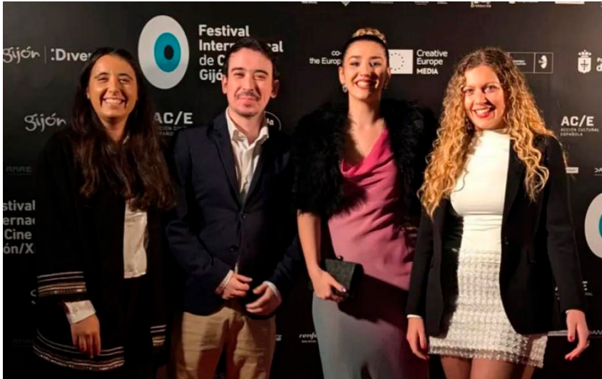
Imagen miembros de los Consejos de Moceda en el FICX

__ OIJ Pola de Lena: Charla sobre gestión de asociaciones (noviembre); taller sobre patriarcado y arte de acción (junio); talleres con “La Revista Caminada” para escolares (junio).