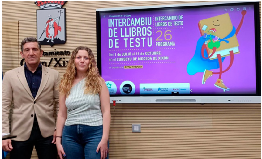
Imagen presentación del Programa Intercambio de libros de texto en el Ayuntamiento de Gijón

Este programa, impulsado por Estudiantes Progresistas y el Conseyu de la Mocedá de Xixón, con la colaboración del Conseyu de la Mocedá del Principáu d'Asturies, permite a estudiantes de Primaria, Secundaria, Formación Profesional y Escuela Oficial de Idiomas acceder de forma gratuita a libros de texto, aliviando el elevado coste económico que supone su compra cada curso. El único requisito para beneficiarse del intercambio es aportar libros del año anterior en buen estado, contribuyendo así al banco común de recursos. Se trata de una iniciativa consolidada que combina sostenibilidad, cooperación y apoyo a la igualdad de oportunidades educativas.