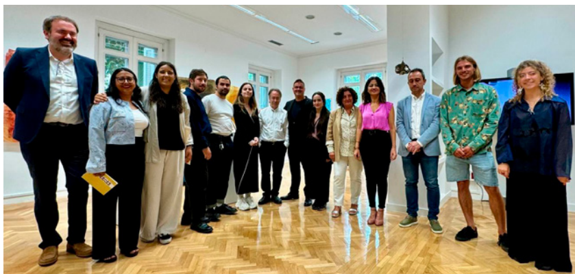
Imágenes diferentes encuentros insitucionales mantenidos por la comisión permanente del CMPA