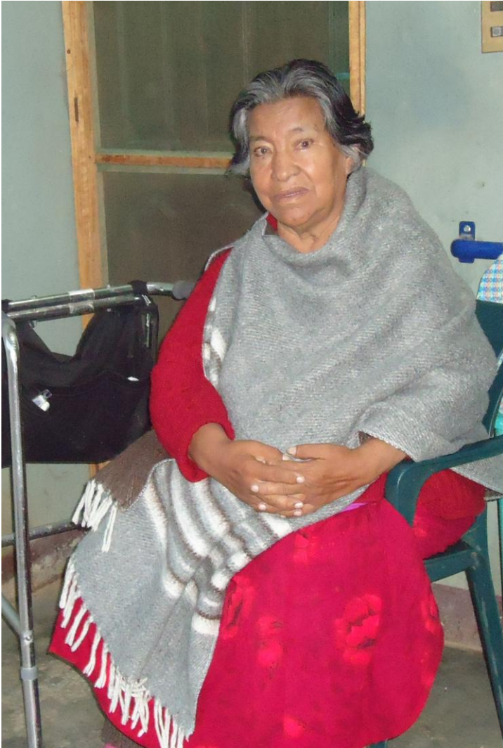
La legendaria líder de las mujeres mineras, Domitila Barrios de Chungara hoy, en su domicilio de Cochabamba

(MMM).- El grito de Domitila Barrios de Chungara que encarna la voz de un pueblo minero que no se rinde ante la adversidad, ante la opresión y represión sigue escuchándose como la orientación del movimiento minero para volver a constituirse en la vanguardia de lucha de los trabajadores. “Si me permiten hablar”,