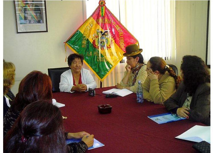
Domitila en oportunidad de su visita al Ministerio de Minería y Metalurgia (2007), conversa con el personal femenino de la institución

Domitila: “no eso no quiero recordarla... en la Noche de San Juan, después perdí mi hijo cuando me pegaron en mi casa y al último el gemelo murió cuando yo estaba perseguida dentro la mina porque estaba en proceso de parto tuve que salirme y cuando di a luz el hombrecito estaba en proceso de descomposición y la mujercita estaba viva (1976).