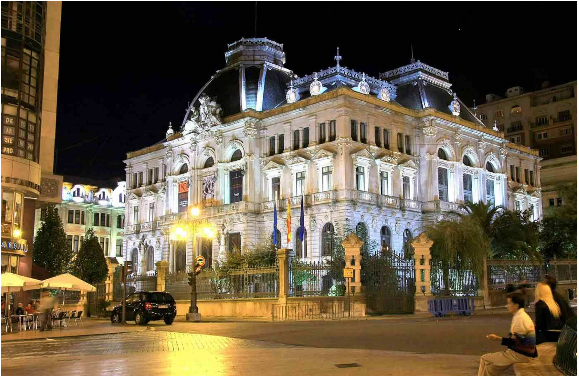
Junta del Principado de Asturias