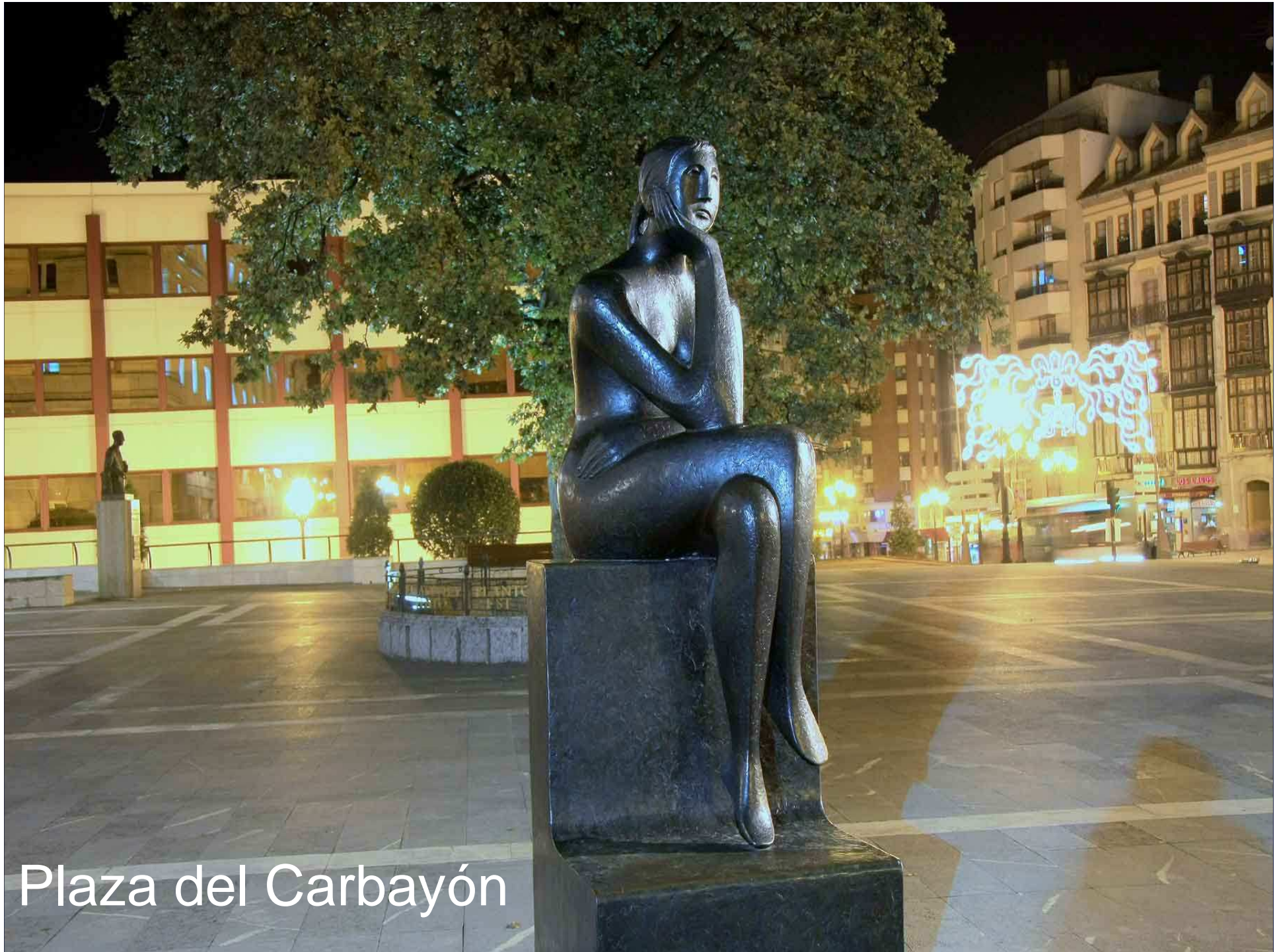
Plaza del Carbayón