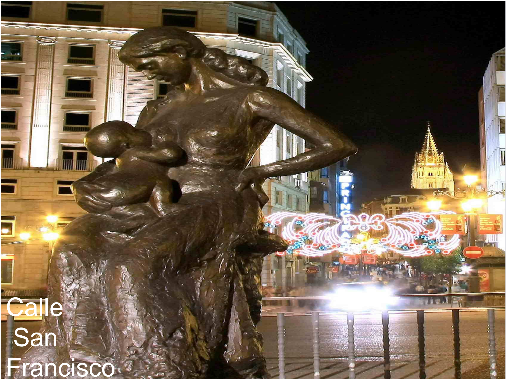
Calle San Francisco