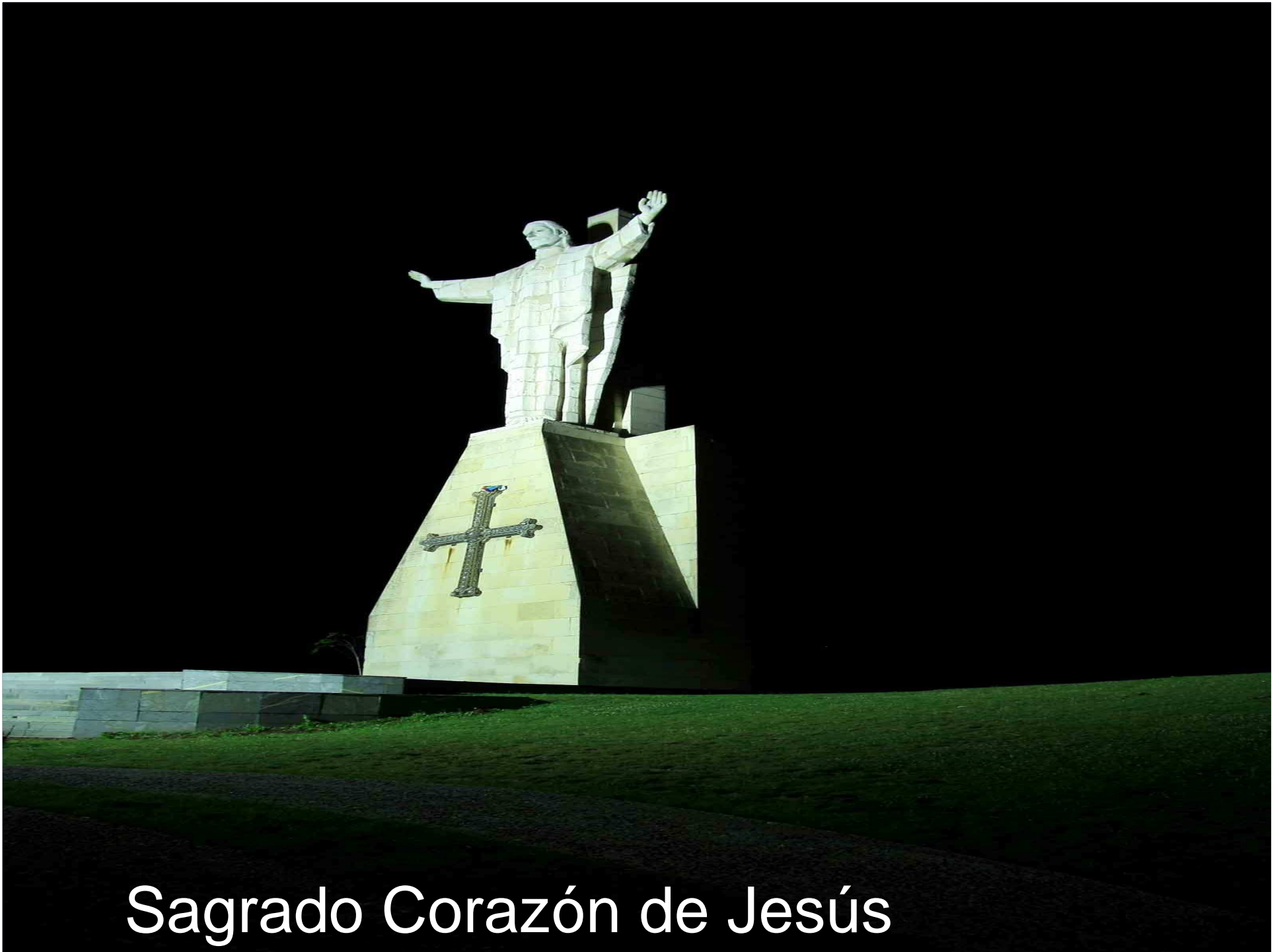
Sagrado Corazón de Jesús