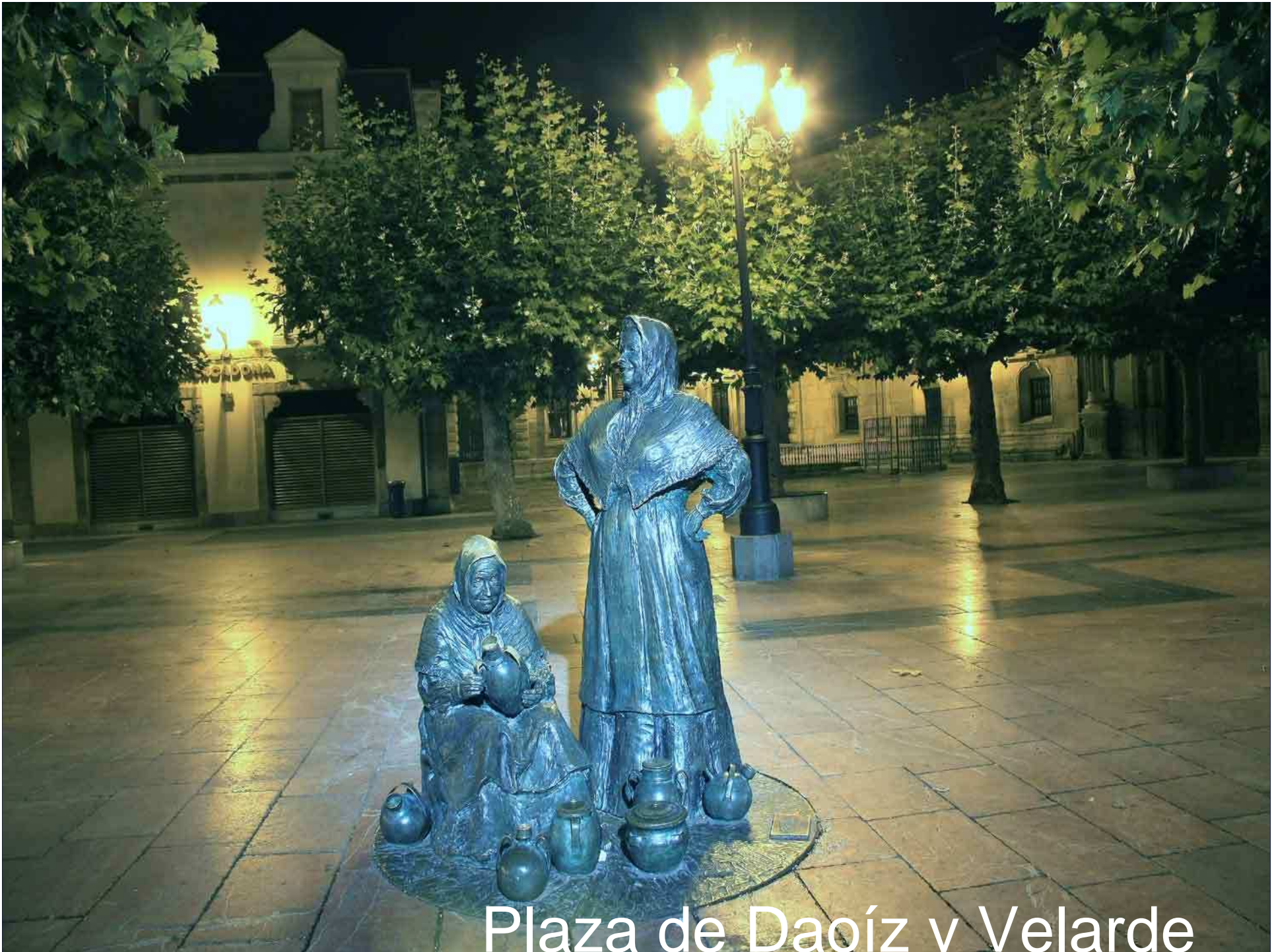
Plaza de Daoíz y Velarde