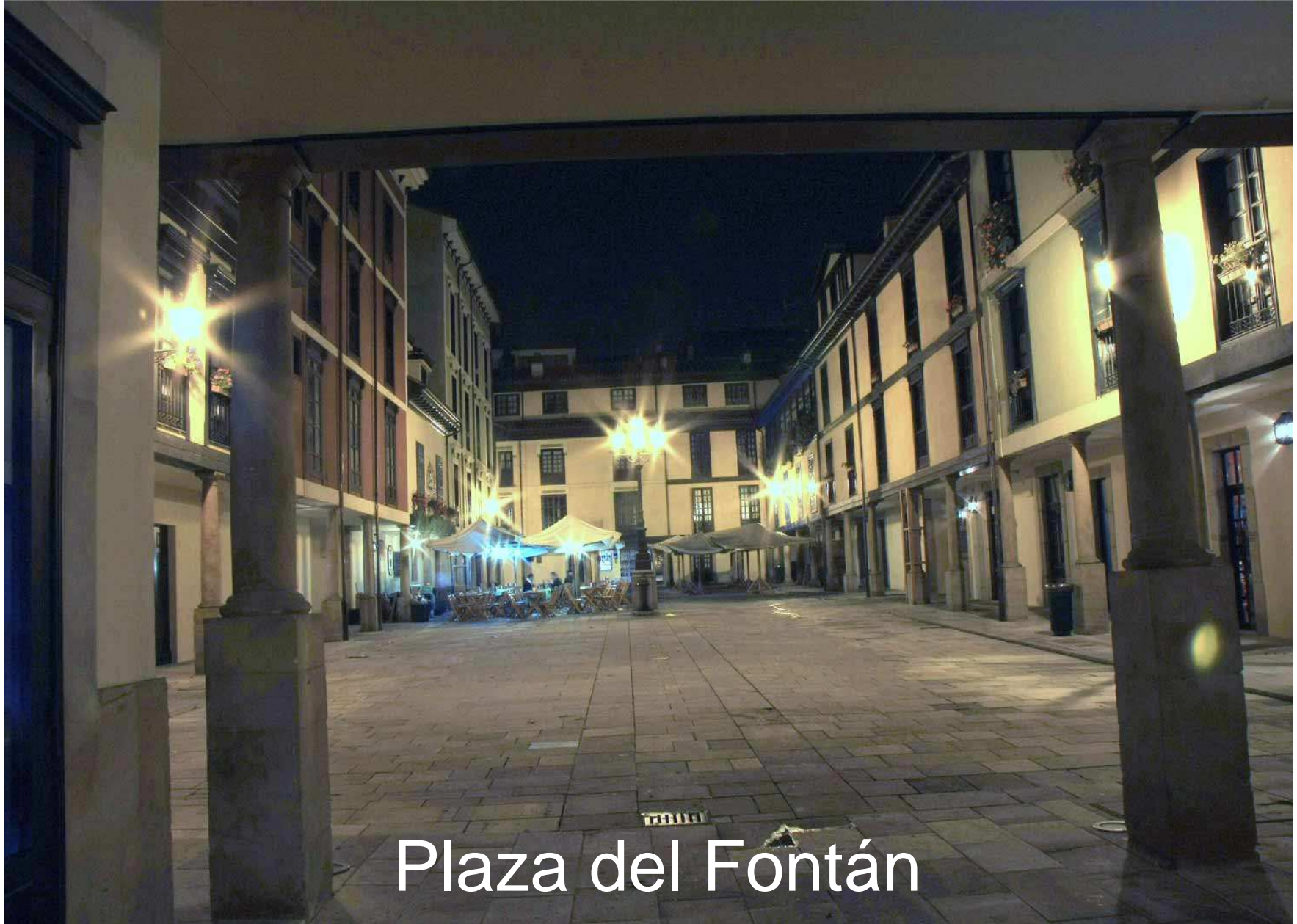
Plaza del Fontán