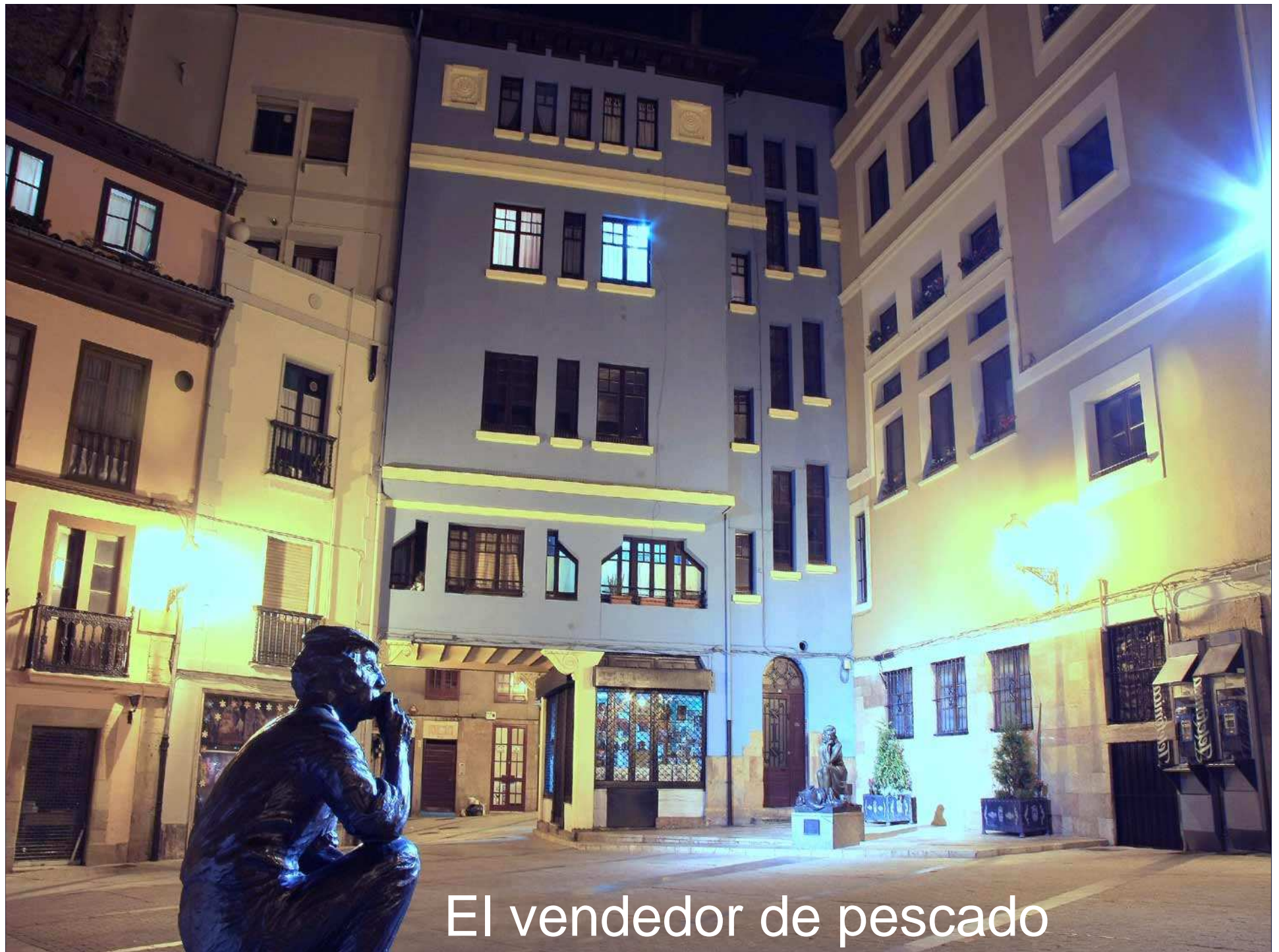
El vendedor de pescado