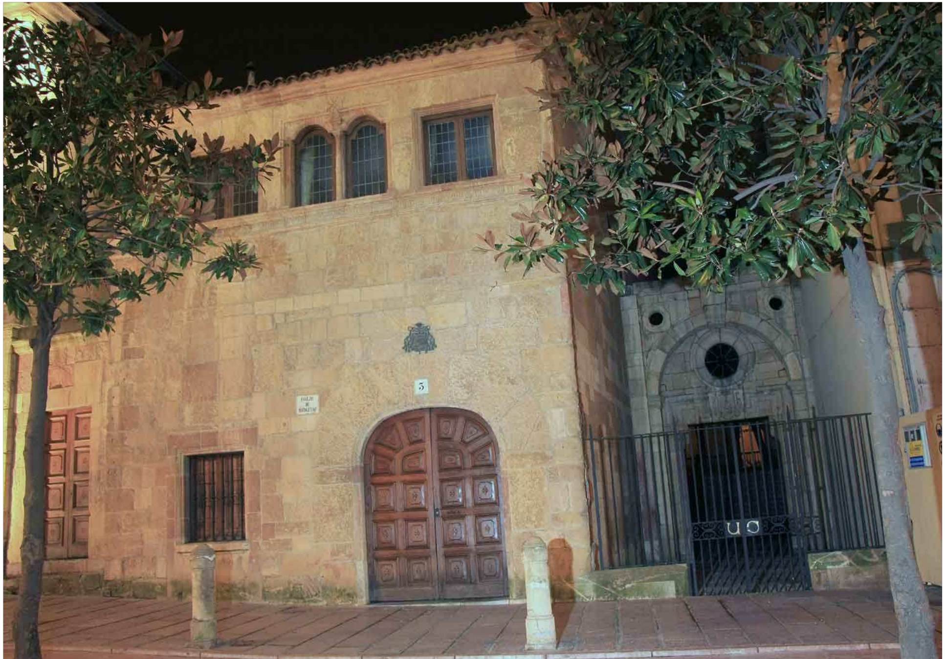
Colegio de Recoletas