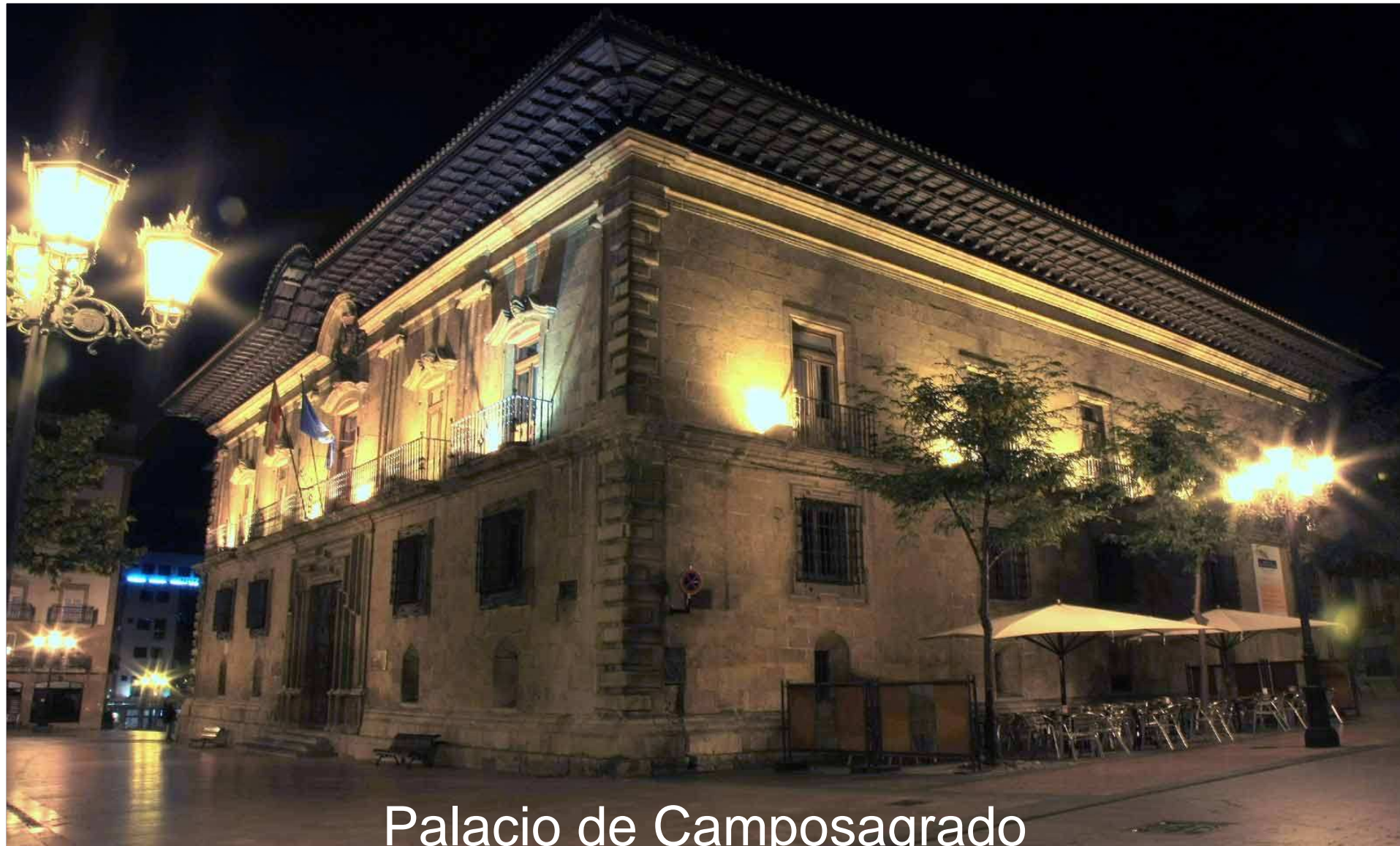
Palacio de Camposagrado