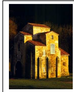
Monumento prerrománico de San