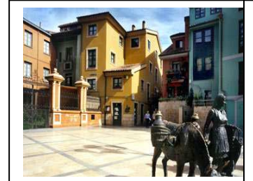
Oviedo Antiguo y sus alrededores