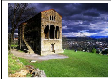
Monumento prerrománico Santa